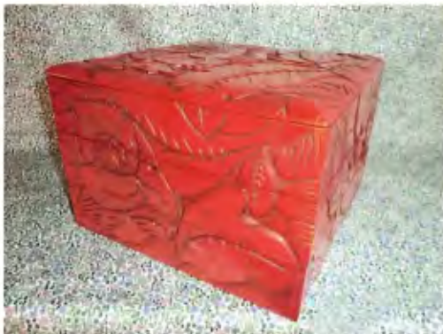
【重箱三段重ね（牡丹）】