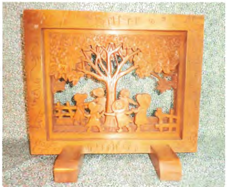
【桜の下で遊ぶ少女達】