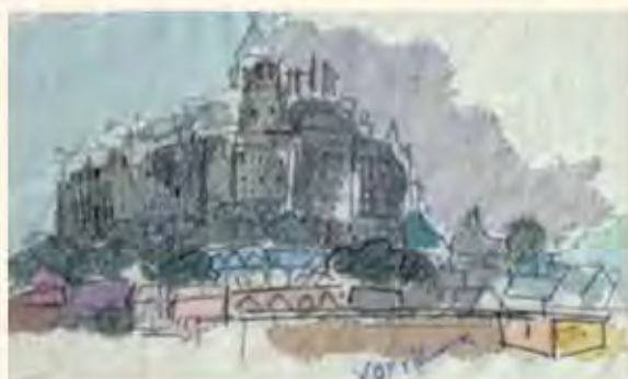
「モンサンミッシェル」